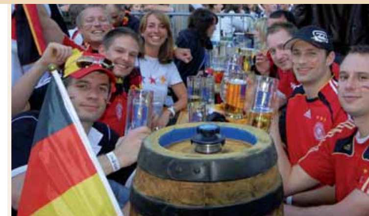
11. Juni - 11. Juli: Fußball-Weltmeisterschaft

Die Übertragungen der Formel1-Rennen können Sie bei uns auf Großbildschirm verfolgen!