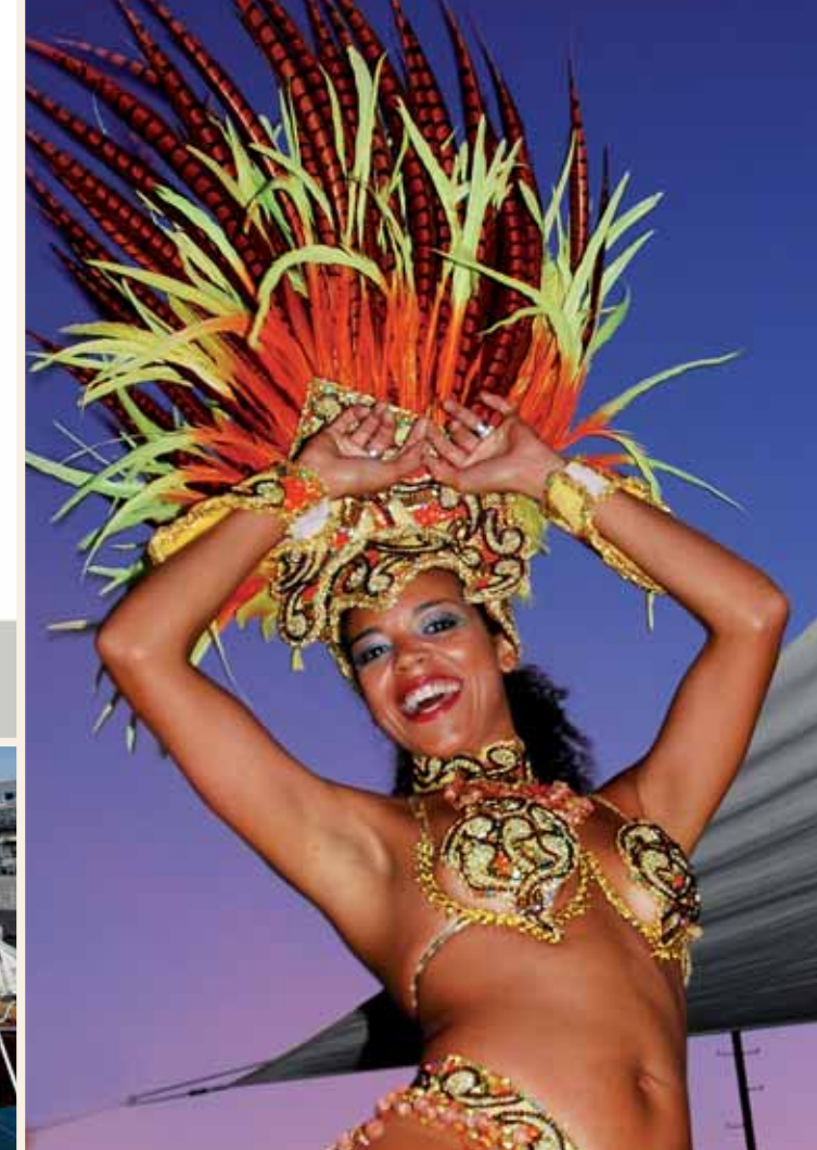
Freitag und Samstag 06./07. August: Fiesta Tropical