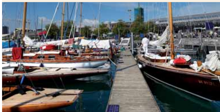
Samstag 12. Juni: Hafenhalle Classic Trophy

Samstag: Vorband: Southern Railway anschl. South Mountain